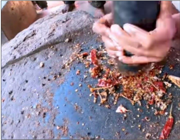
රූපසටහන 02: මිරිස් ඇඹරීම

මෙහි පැමිණෙන බැතිමතුන් අතර දේශපාලනඥයින් ව්‍යාපාරිකයින් දමිළ ජාතිකයන් සිංහල බෞද්ධයන් ධීවරයන් ඇතුළු බොහෝ බැතිමතුන් පිරිසක් වේ. එහිදී තෙල්, මල් හඳුන්කුරු කපුරු ඔවුහු රැගෙන එති. මිරිස් ඇඹරීම මේ දේවාලයට විශේෂ ආවේනික කටයුත්තකි. මිරිස් ඇඹරීමට එන පුද්ගලයන් එහි පවතින මව් ගල හෙවත් මිරිස් ඇඹරීම සඳහා යොදා ගන්නා ගෝලාකාර ගලකින් රැගෙන එන ලද සැර පහකින් යුත් වියළි මිරිස්, ගම්මිරිස්, අබ, අමු ඉඟුරු යනාදිය ගෙනැවිත් එම ද්‍රව්‍ය එකට දමා අඹරමින් මා වෙත නොව ප්‍රතිවිරුද්ධ දෙසට අඹරමින් තමාට වූ අසාධාරණය දෙවියන් වෙත යොමු කිරීම සිදු කරයි (රූපසටහන 02). සීනිගම වසර ගණනාවක් තිස්සේ මිනිසුන් ශාප කිරීම සඳහා භාවිතා කළ අයගේ සිත් තුළ දැන් විශේෂ බලයක් ඇත. මෙම ආයතනයේ වැදගත් ම අංගය වන්නේ ශාප නිෂ්පාදනයයි. එය වාචිකව සිදු කරනු ලැබේ. සේවාදායකයාට ඔහු හෝ ඇය අසල වාඩි වී සිටින කපුවා විසින් උපදෙස් දෙන ලද ඔහුගේ හෝ ඇයගේ ශාපයේ වචන උච්චාරණය කළ යුතු ය. Feddema (1997) දක්වන ආකාරයට කපුවා මුලින් ම සේවාදායකයා නොදැනුවත්ව ම විරුද්ධවාදියාට අවශ්‍ය දේ ඔහු පවසයි: මරණය, බරපතල මානසික රෝගයක්, අනතුරක්, කකුල් කැඩීම හෝ පදිංචි ගම හැර යාමට බල කිරීම සිදු කරයි.