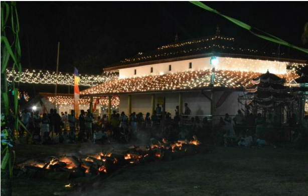
රූපසටහන 01: ගිනි පැරීම සඳහා සූදානම් කරන ලද දේවාල භූමිය

නොදා තියන ගඟ දිය මෙන් සිහිල් වෙව් උදාර යෙන් පැන ගිනි මැදට සැක තෙව් අ දා සිතින් ගොඩබටු අණසක බෝව් එදා පතිනි නම් තැබුවේ දෙවොල් දෙව් (ධර්මදාස සහ තුන්දෙනිය, 1994).